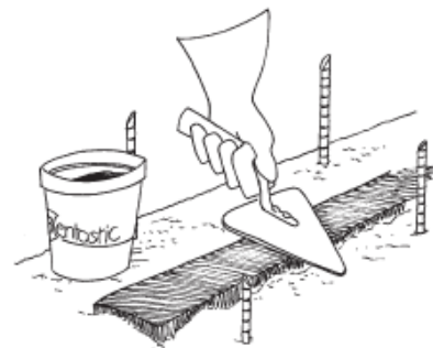
2. Jei reikia, paviršių išlyginkite