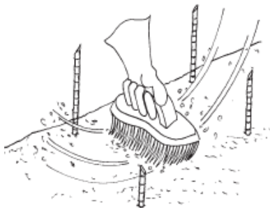
1. Pašalinkite nuo paviršiaus nešvarumus

Vengti darbo su juosta stipraus lietaus metu, nes tai gali sąlygoti priešlaikinį brinkimą.